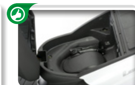
"Bajo el asiento hay espacio para guardar un casco integral, algo justito pero suficiente".

es la plataforma totalmente plana que, como gusta al respetable, es considerablemente espaciosa. Este modelo, además, recibe un nuevo sistema de iluminación formado por un único faro con parábola multirreflector y una bombilla halógena y, detrás, un generoso piloto de leds.