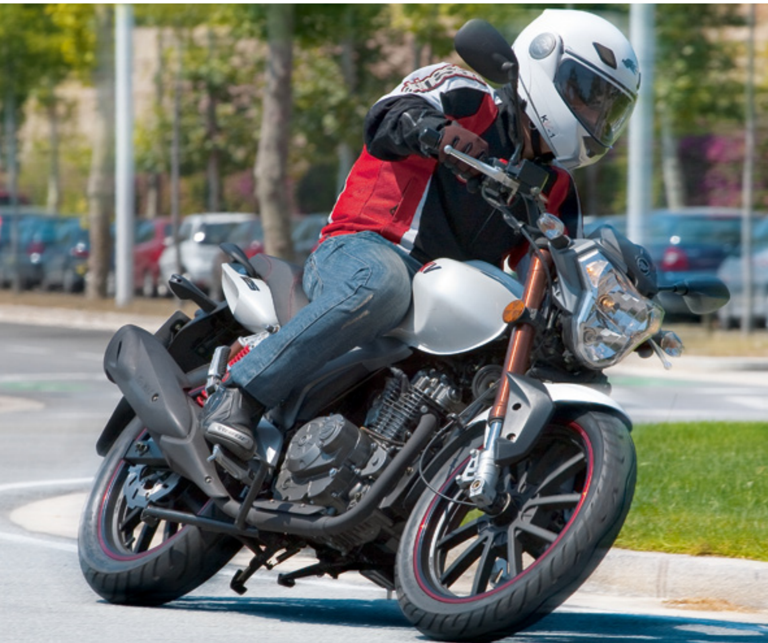
LA NUEVA PROPUESTA DE KEEWAY PARA LA CIUDAD